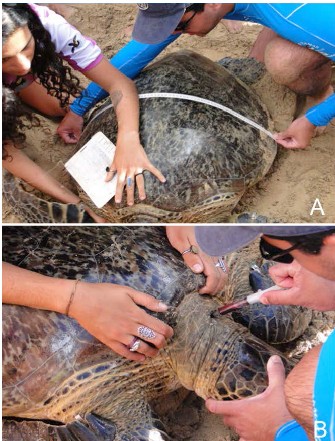
Fig.1. Manejo dos animais após a captura na Baía do Sueste, Fernando de Noronha. (A) Identificação e coleta de dados do animal capturado, (B) Coleta de sangue em seio venoso cervical para análise.

Nos estudos de repetibilidade e reprodutibilidade obtiveram-se coeficientes de variação menor que 5% em todas as análises, portanto a metodologia analítica utilizada se mostrou confiável. A repetibilidade expressa a fidelidade obtida nas mesmas condições operacionais, aplicadas em um curto intervalo de tempo pós coleta (inferior à 12 horas pós coleta, sob refrigeração). A reprodutibilidade designa a fidelidade da análise num intervalo de tempo, geralmente obtida em análises diárias. A principal função da reproduti-